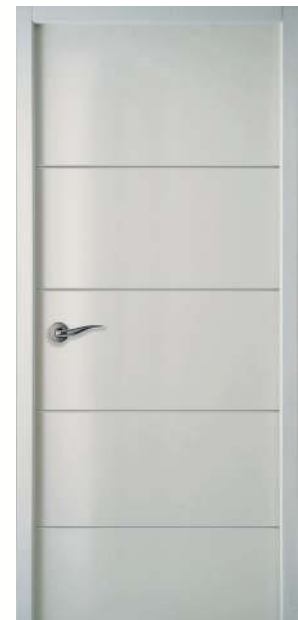
MODERNA HORIZON (Climat B et C)