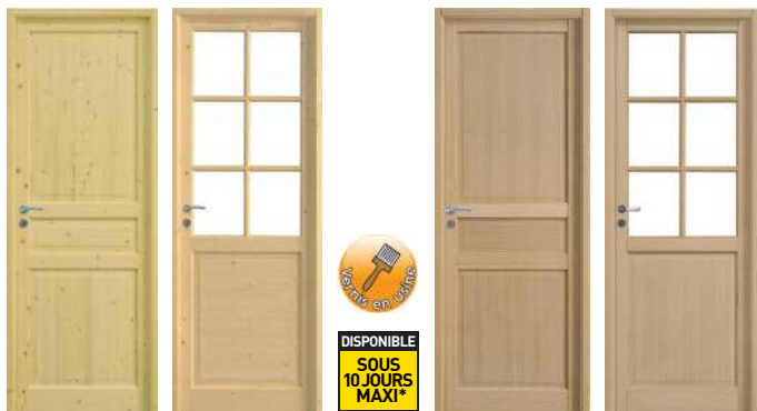
CIRCÉE TRINIE à vitrer JADE PYRITE à vitrer

Des blocs-portes menuisés plaqués Chêne 1 er choix, bruts ou vernis, alliant noblesse et robustesse.