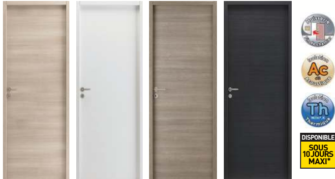
ELIS Chêne cendré ELIS Blanc ELIS Gris taupe ELIS Noir

LES STRUCTURÉS : Décor aspect bois mélaminé reprenant la structure et le veinage du bois. Modèle ELIS plein se déclinant en 4 décors structurés : Chêne cendré, Blanc, Gris taupe et Noir.