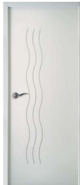
MODERNA CASCADE (Climat B)