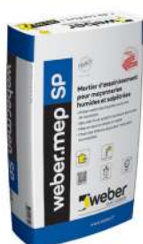
WEBER.MEP SP Mortier d'assainissement pour maçonneries humides et salpêtrées. Sac de 25 kg.