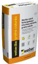
WEBER.LITE GRAINS COLORÉS Mortier coloré forte épaisseur à la chaux aérienne. Sac de 25 kg.