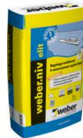
WEBER.NIV ELIT Ragréage autolissant des sols intérieurs à recouvrement rapide (P3R). Sac de 25 kg.