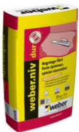
WEBER.NIV DUR Ragréage fibré forte épaisseur spécial rénovation (P4SR). Sac de 25 kg.