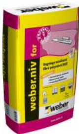
WEBER.NIV FOR Ragréage autolissant fibré polyvalent (P3R). Sac de 25 kg.