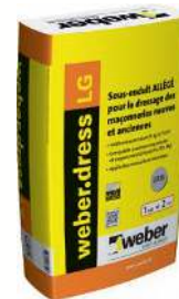
WEBER.DRESS LG Sous-enduit allégé à la chaux aérienne projeté. Sac de 25 kg.