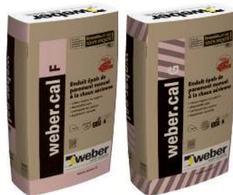
WEBER.CAL F ET G Enduits épais de parement manuels à la chaux aérienne. Sac de 25 kg.