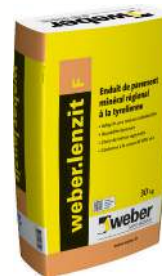
WEBER.LENZIT F Enduit tyrolien. Sac de 30 kg.