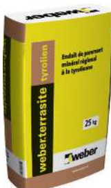
WEBER.TERRASITE TYROLIEN Enduit tyrolien. Sac de 25 kg.