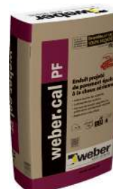
WEBER.CAL PF Enduit épais de parement projetés à la chaux aérienne. Sac de 25 kg.