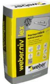
WEBER.NIV LEX Ragréage spécial extérieur. Sac de 25 kg.