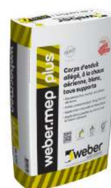
WEBER.MEP PLUS Corps d'enduit allégé à la chaux aérienne pour le dressage des maçonneries anciennes. Sac de 25 kg.