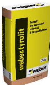
WEBER.TYROLIT Enduit tyrolien. Sac de 25 kg.