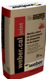
WEBER.CAL JOINT Mortier coloré de jointoiement de plaquettes et de briques. Sac de 25 kg.