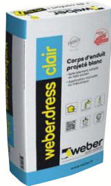
WEBER.DRESS R Sous-enduit à la chaux aérienne projeté. Sac de 25 kg.